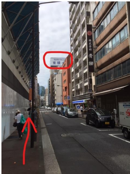
⑨右前方に東横インの看板をみながら200mほど進みます