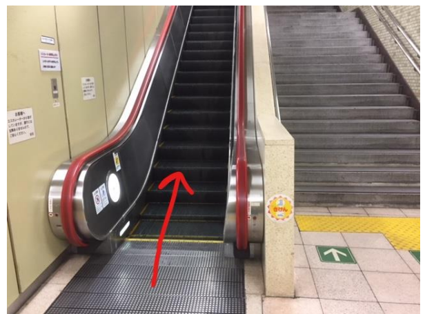
④上りエスカレーターであがります