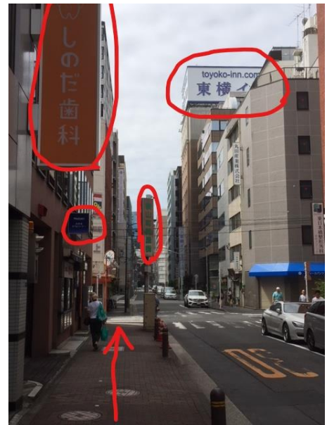
⑩しのだ歯科、みずほ銀行、ローソンなどを見ながら進みます