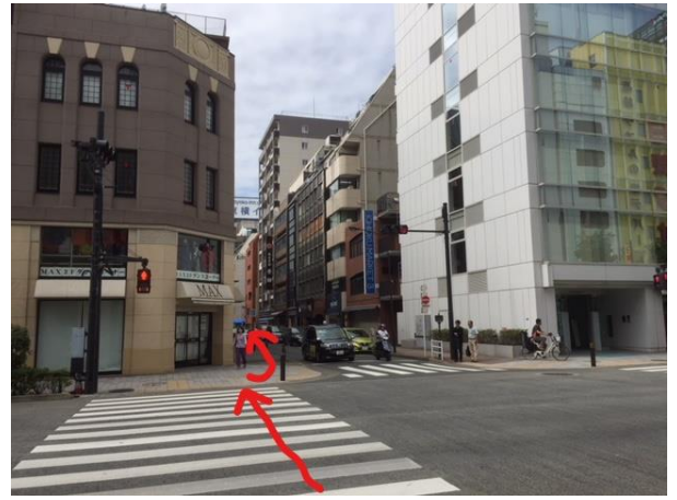
⑧横断歩道を渡り、スギ薬局の横の道（横山町大通）を進みます