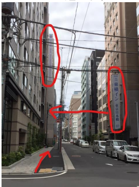
⑪マンションの隣、東横インの正面がメディカルプライム日本橋小伝馬町のビルです