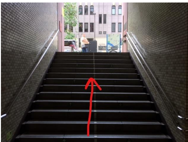
⑤最後に少し階段があります