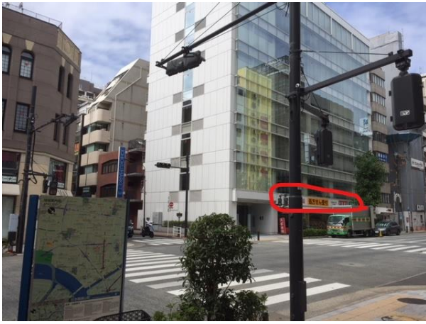
⑦右前方にスギ薬局が見えます