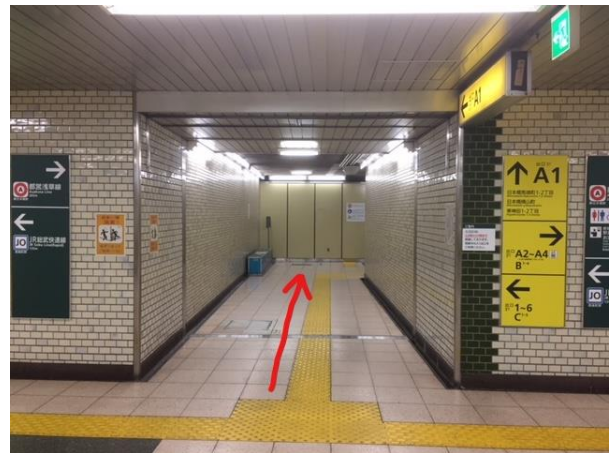
②改札口の正面のA1出口から地上に出ます