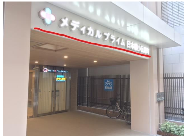
⑫3Fが当院になります